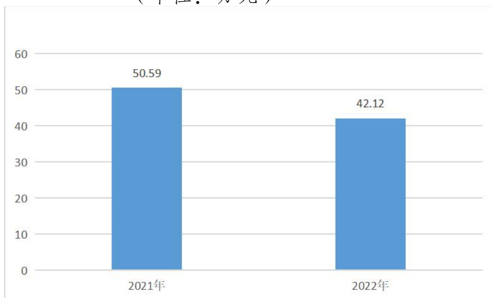
图 4：财政拨款收、支决算总计变动情况 (单位：万元)

2022年度财政拨款收、支总计 42.12 万元。与 2021年度相比，财政拨款收、支总计减少 8.47 万元，下降 16.74%。