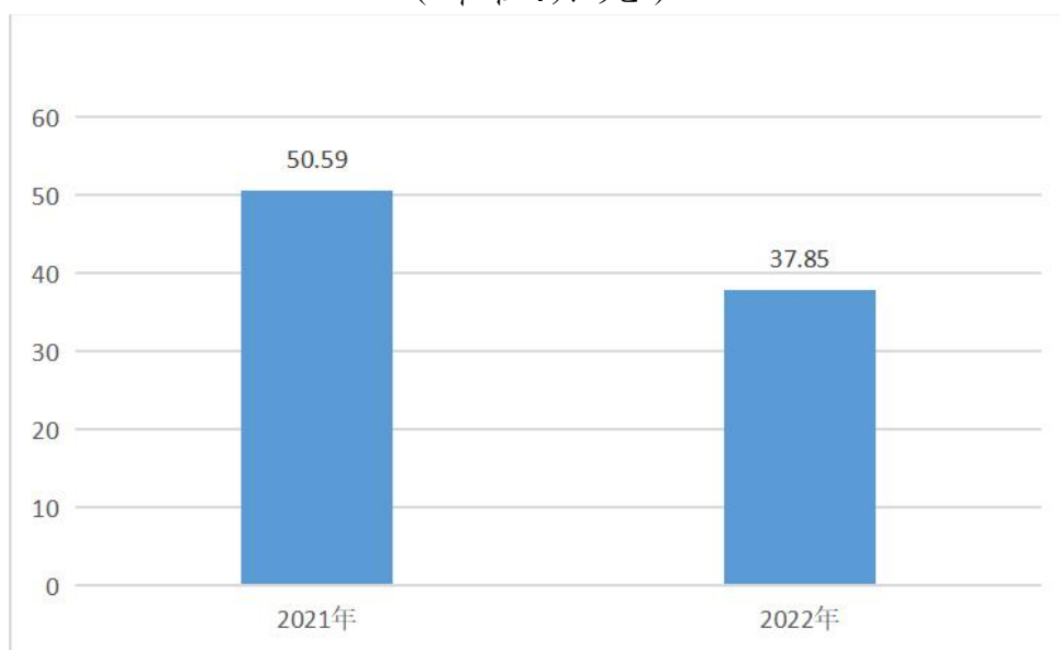
图 5：财政拨款支出决算变动情况 (单位:万元)

2022年度财政拨款支出 37.85 万元，占本年支出的 8.47%。与 2021年度相比，财政拨款支出减少 12.74 万元，下降 67.88%。